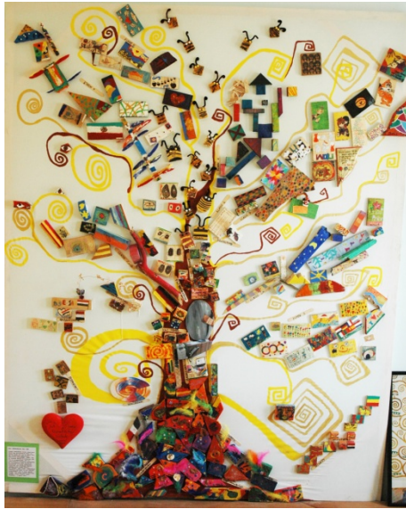
(Lebensbaum der DS Hurghada, nach G. Klimt)